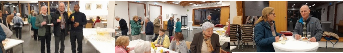
„Jubeltreffen 2025“ am 29.3. im Pfarrsaal: