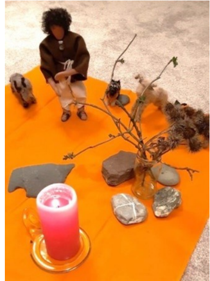
GOTT -wer ist das? Er offenbart sich Mose am brennenden Dornbusch

ist die Idee der „LIVE vor Ostern“-Abende.