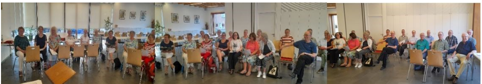
Grötzingener Chöre proben für den ökumenischen Gottesdienst zur Kulturmeile.