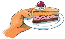
Grafik: Ines Rarisch

Kuchen können gerne auch spontan - ohne vorhergehende Anmeldung - am 27. Juli abgegeben werden. Kurz vor dem Gottesdienst in der Schneiderscheune oder direkt im Anschluss an den Gottesdienst, wenn das Gemeindefest beginnt.